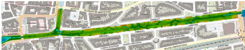
Afbeelding 1: Op het bovenstaande kaartje staat het projectgebied. Het gaat om het Nieuwe Kanaal en een stukje Zuiderstadsgracht.